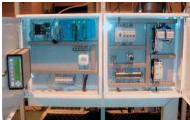
Рис. 2. Электрический шкаф

тивовес спрятан в полость центральной станины стенда.