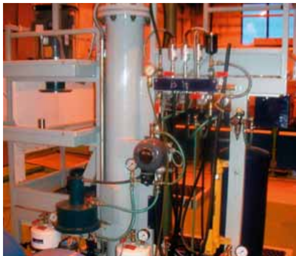
Рис. 6. Датчики и исполнительные устройства стенда

пьютером учебного класса. На каждом стенде АРМ оператора управляет только соответствующим тестом. На АРМ мастера поступают отчёты со всех стендов и при необходимости распечатываются. Мастер не полномочен вмешиваться в процесс тестирования, однако наблюдать за ним может. Компьютер учебного класса не наделён управляющими функциями, а служит только для отслеживания действий оператора и организации просмотра в реальном масштабе времени текущих мнемосхем процесса тестирования.