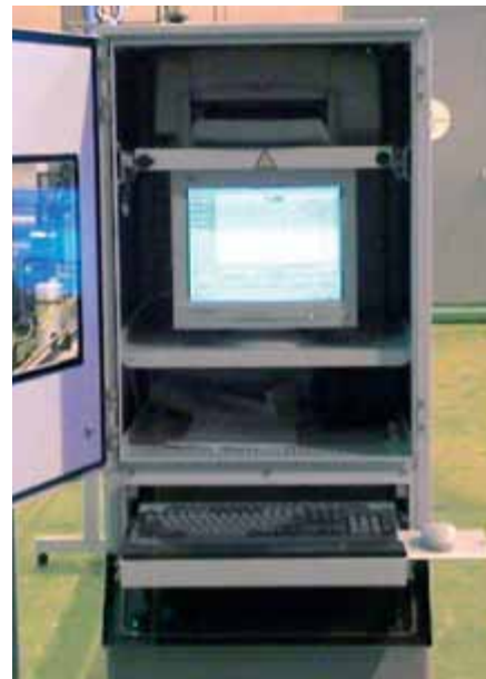
Рис. 3. Рабочее место оператора

Так же контролируется температура ГЗ. Измеренные параметры сравниваются с допусками, и