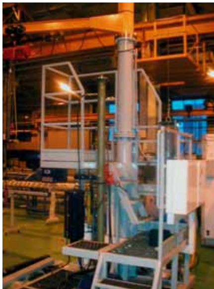
Рис. 1. Общий вид стенда

Силовой модуль подвешен на стальном тросе и сбалансирован противовесом таким образом, чтобы оператор мог руками поднимать или опускать модуль при его установке на ГЗ. Про-